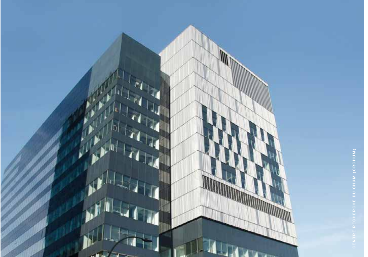
CENTRE RECHERCHE DU CHUM (CRCHUM)