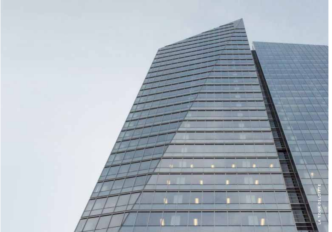
LA TOUR DELOITTE