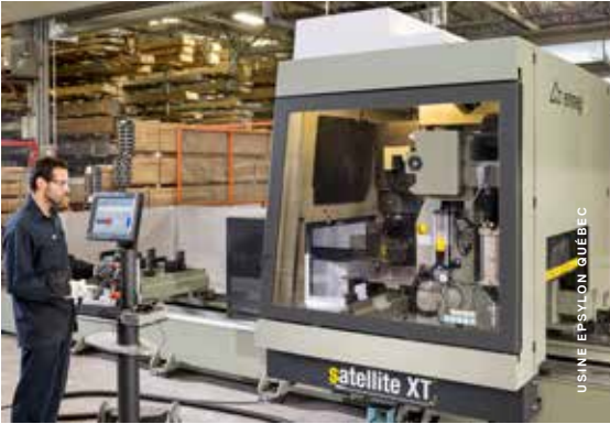
USINE EPSILON QUÉBEC

La productivité de notre usine est considérablement augmentée par l'acquisition de quatre centres d'usinage à contrôle numérique à cinq axes de marques Elumatec et Emmegi. Deux scies à contrôle numérique et deux unités de distribution dosée de scellant complètent l'équipement haute performance dont est dotée notre usine.